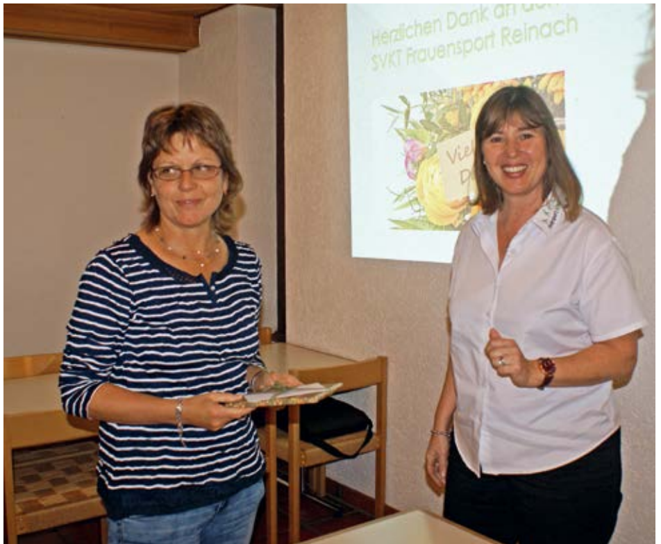
Verdankung der Organisation an den SVKT Frauensport Reinach