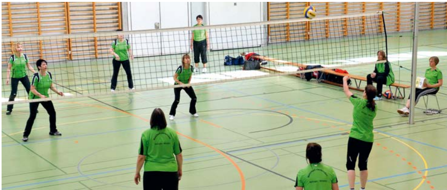
Zahlreiche Spielformen und noch viel mehr lernten die Kursteilnehmerinnen am esa-Vertiefungskurs kennen

Für das erstmals durchgeführte Vertiefungsmodul esa Ballsport in Oberrohrdorf am 21. und 22. Oktober hatten sich 13 Frauen aus der ganzen Schweiz angemeldet. Nach einer kurzen Begrüssungs- und Vorstellungsrunde in den unterschiedlichsten Schweizer Dialekten ging es dann schnell zur Sache, zum Hauptthema Netzball.