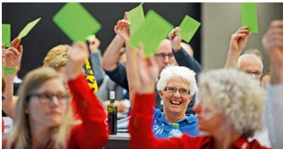
Freude bei der Abstimmung über das offensichtliche Ergebnis