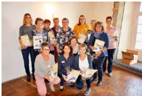
Die geehrten Vereinsmitglieder

Ausserordentlich, ausser Plan oder einfach den Umständen angepasst und ins Jahr eingeschoben. Grundsätzlich wäre ja zu dieser Zeit die Herbstkonferenz für die Präsidentinnen und Leiterinnen eingeplant gewesen. Aber wir Frauen sind flexibel und können uns auf neue Herausforderungen einstellen.