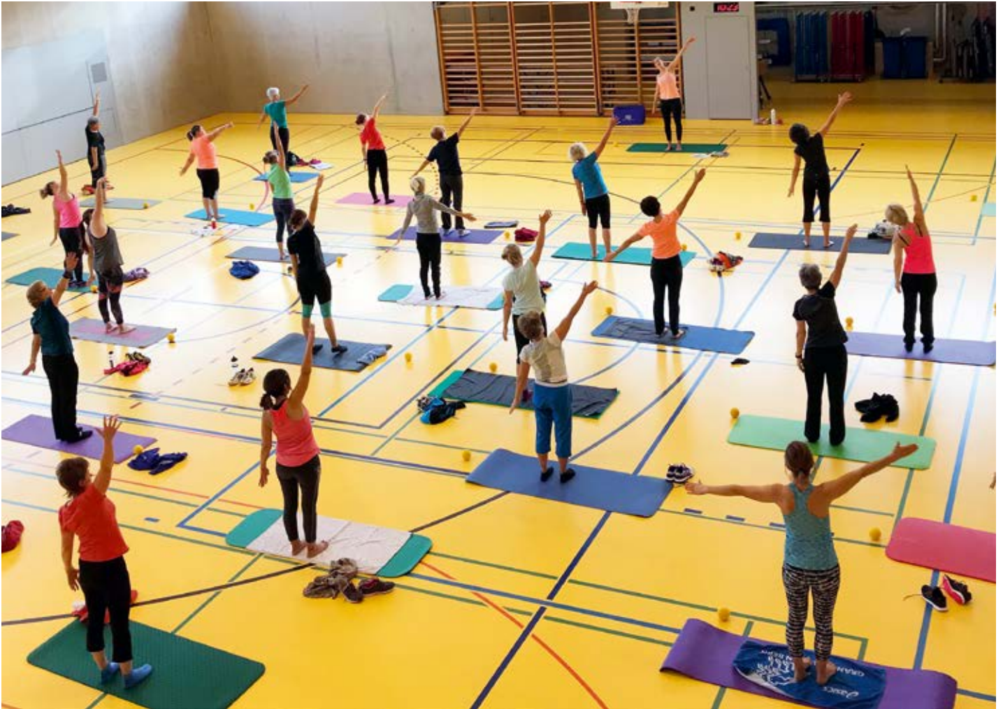
7.SVKT Bewegungs- und Erlebnisevent