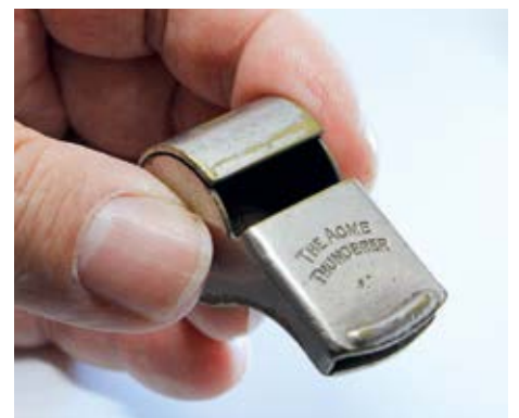
«Gut Pfiff» wurde den angehenden Schiedsrichterinnen und Schiedsrichtern gewünscht