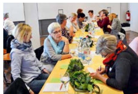
Viele Interessierte erschienen zur a.o. DV

Die Ehrungen können online auf www.svkt.ch nachgelesen werden.