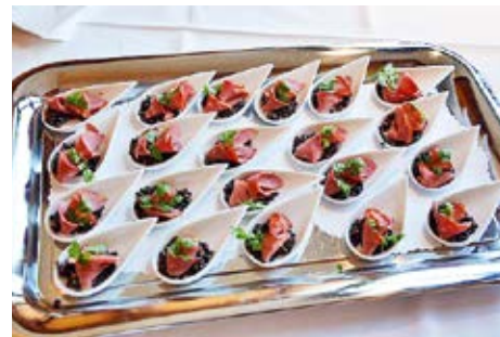
...beim Apéro Riche.

Bei der ausserordentlichen Delegiertenversammlung des SVKT Frauensportverbands Ostschweiz am 4. November konnten die Co-Präsidentinnen über 50 Delegierte und Gäste begrüßen, welche den Weg nach Wil gefunden hatten. Sie waren gespannt, wie sich die Zukunft des Frauensportverbands Ostschweiz gestalten würde. An dieser Sitzung aber wurden auch noch langjährige Vorstandsmitglieder und Leiterinnen geehrt. Doch alles der Reihe nach.